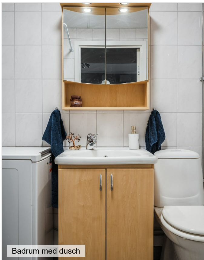
Badrum med dusch