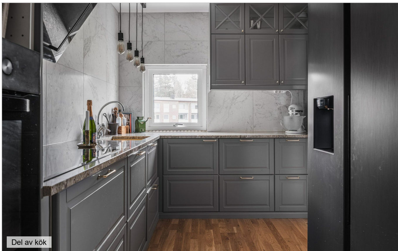
Del av kök