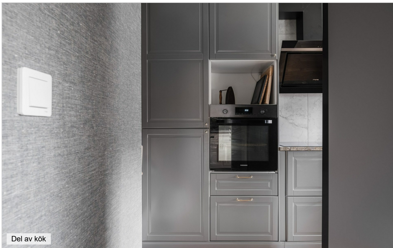
Del av kök