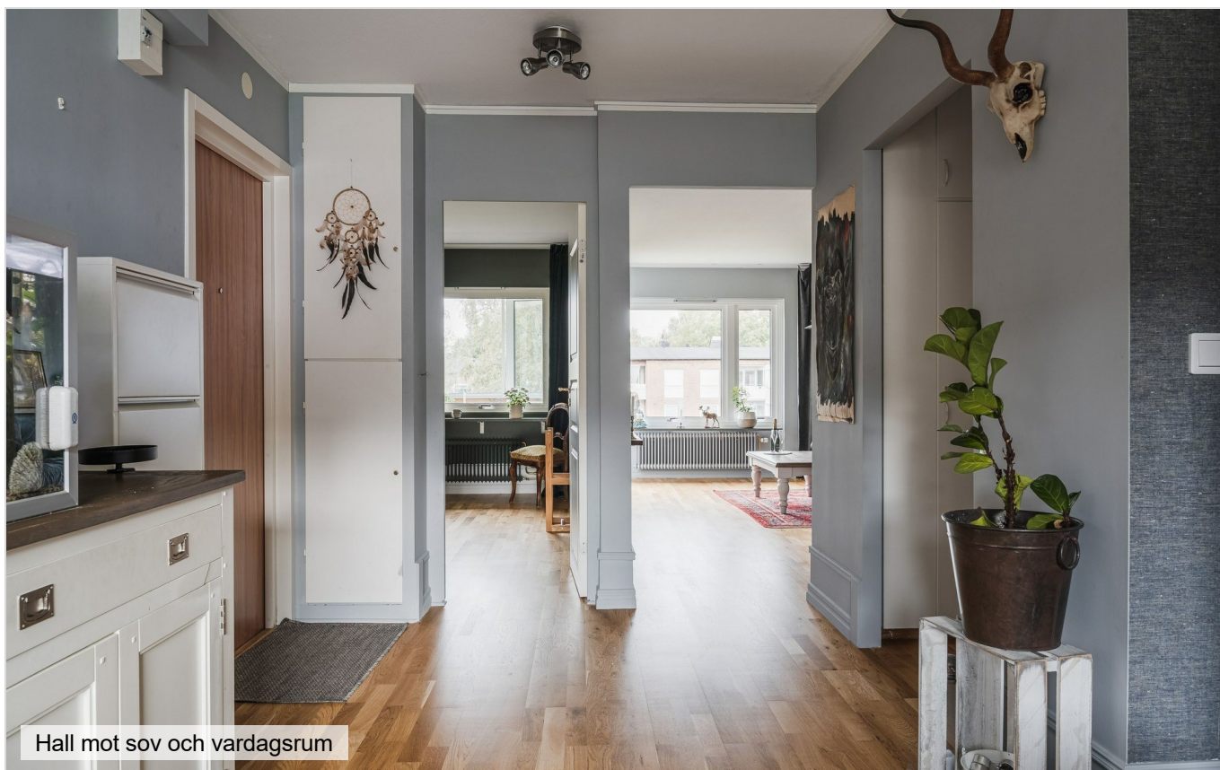
Hall mot sov och vardagsrum